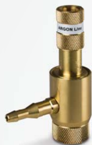
CONNETTORE Portata variabile da 4 a 30 l/min

Permette di alimentare contemporaneamente il flusso di gas in torcia e di protezione al rovescio